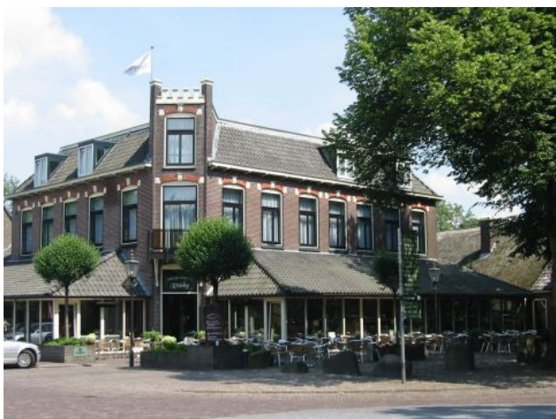
Hotel Wesseling in Dwingeloo

De totaalprijs bedraagt € 197,50 per persoon voor een 2-persoonskamer. Wilt u zo'n kamer alleen bezetten, dan kost dat € 20,- meer. Er zijn misschien nog kamers beschikbaar. Dus aarzel niet en geef u op voor dit gezellige en sportieve weekend.